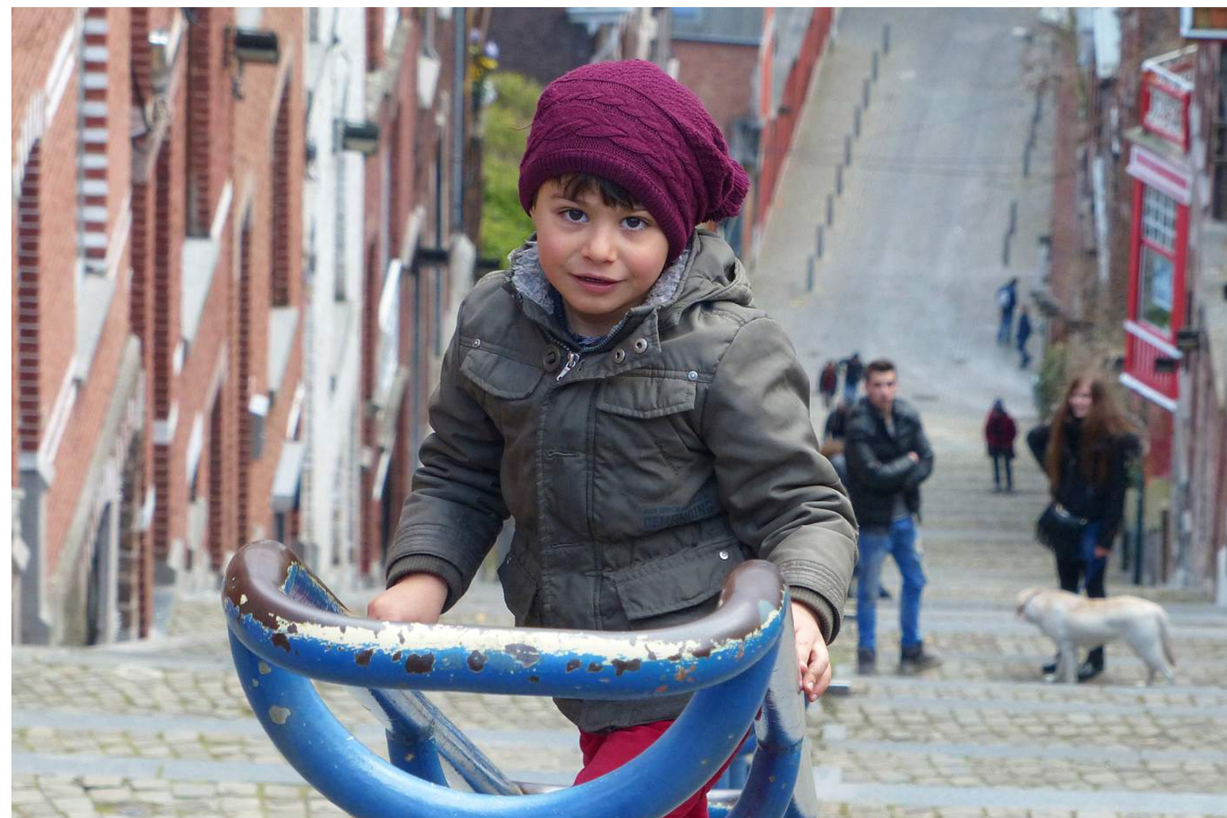
Montagne de Bueren in Luik. (374 treden) Op de clubavond van 4 oktober laten we een serie foto's zien

Traditiegetrouw gaan we de week voor Pasen samen op pad om te fotograferen. We vertoeven dan ergens in Nederland of België in een huisje. Voor de maaltijden zorgen we zelf. Iedereen kan mee; voor nieuwe leden is dit de ideale manier om lekker te fotograferen, en enkele clubleden goed te leren kennen. Het wordt een leerzame en gezellige week. Ervaren leden delen hun kennis met minder ervaren leden en leren op hun beurt weer van hun frisse blik, kortom er zal een creatieve kruisbestuiving plaatsvinden.